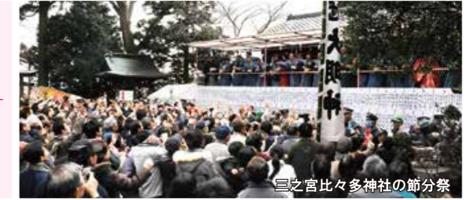
三之宮比々多神社の節分祭