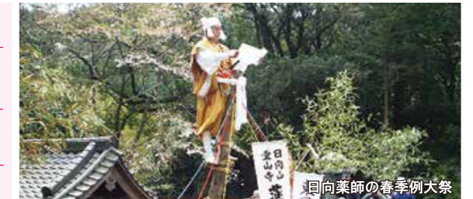
日向薬師の春季例大祭