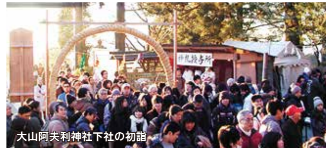
大山阿夫利神社下社の初詣