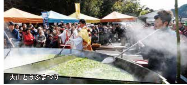
大山とうふまつり