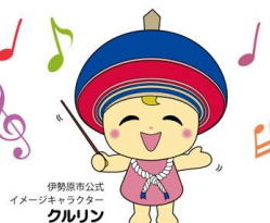
伊勢原市公式 イメージキャラクター クルリン

日時 2月3日(日) 開場 13:30 開演 14:00 場所 伊勢原市民文化会館大ホール アクセス 伊勢原駅北口より徒歩13分 入場料 一般1,000円 中学生以下500円 問い合わせ 伊勢原市民文化会館事業協会 TEL:0463-92-2300