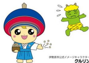
伊勢原市公式イメージキャラクター クルリン

アクセス 伊勢原駅北口より徒歩10分 問い合わせ 伊勢原大神宮 TEL:0463-96-1611